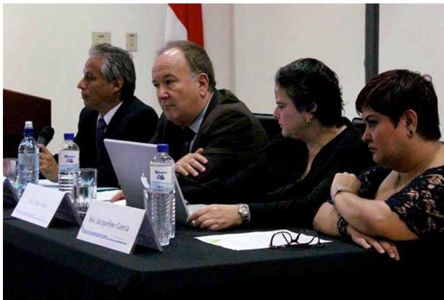
El pasado 20 de agosto se llevó a cabo el conversatorio “Educación, Estado y Mercado” organizado por el Observatorio de Educación Nacional y Regional

Al mismo tiempo, Monge destacó que se espera continuar con este tipo de iniciativas relacionadas con los objetivos del proyecto y seguir promoviendo actividades que incidan en la política educativa.