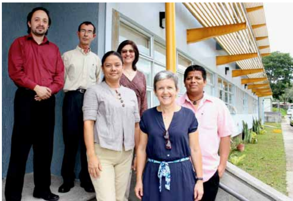
El equipo de investigadoras e investigadores del Observatorio busca incidir en la política educativa nacional y regional

El Observatorio nace como una iniciativa del Instituto de Investigación en Educación (INIE), para el análisis, reflexión e investigación que permita la incidencia en la política educativa nacional y regional.