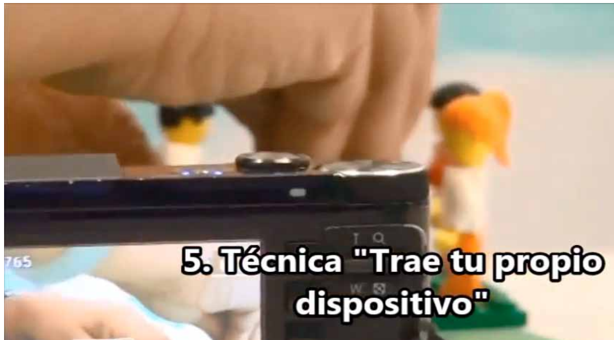
Imagen del Video Stop Motion en la Educación, que presentó la experiencia de PROTEA en I Congreso Internacional de Innovación en la Docencia.

https://www.youtube.com/watch?v=BxnXcNhMpLE&hd=1