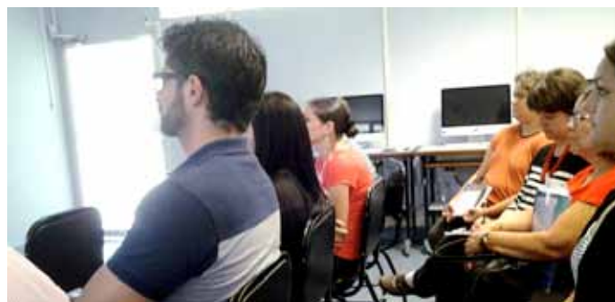
Se contó con la participación docentes tanto de la Universidad de Costa Rica como de la Universidad Nacional

Ante esto, el Dr. Lupiáñez mostró interés en establecer un convenio formal entre la Universidad