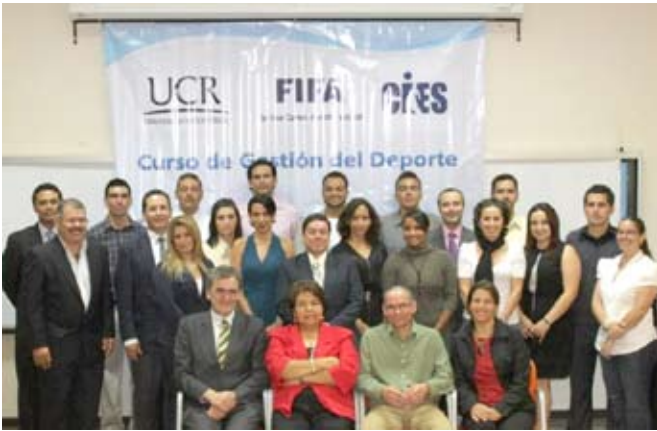
Generación 2011, tercera edición.